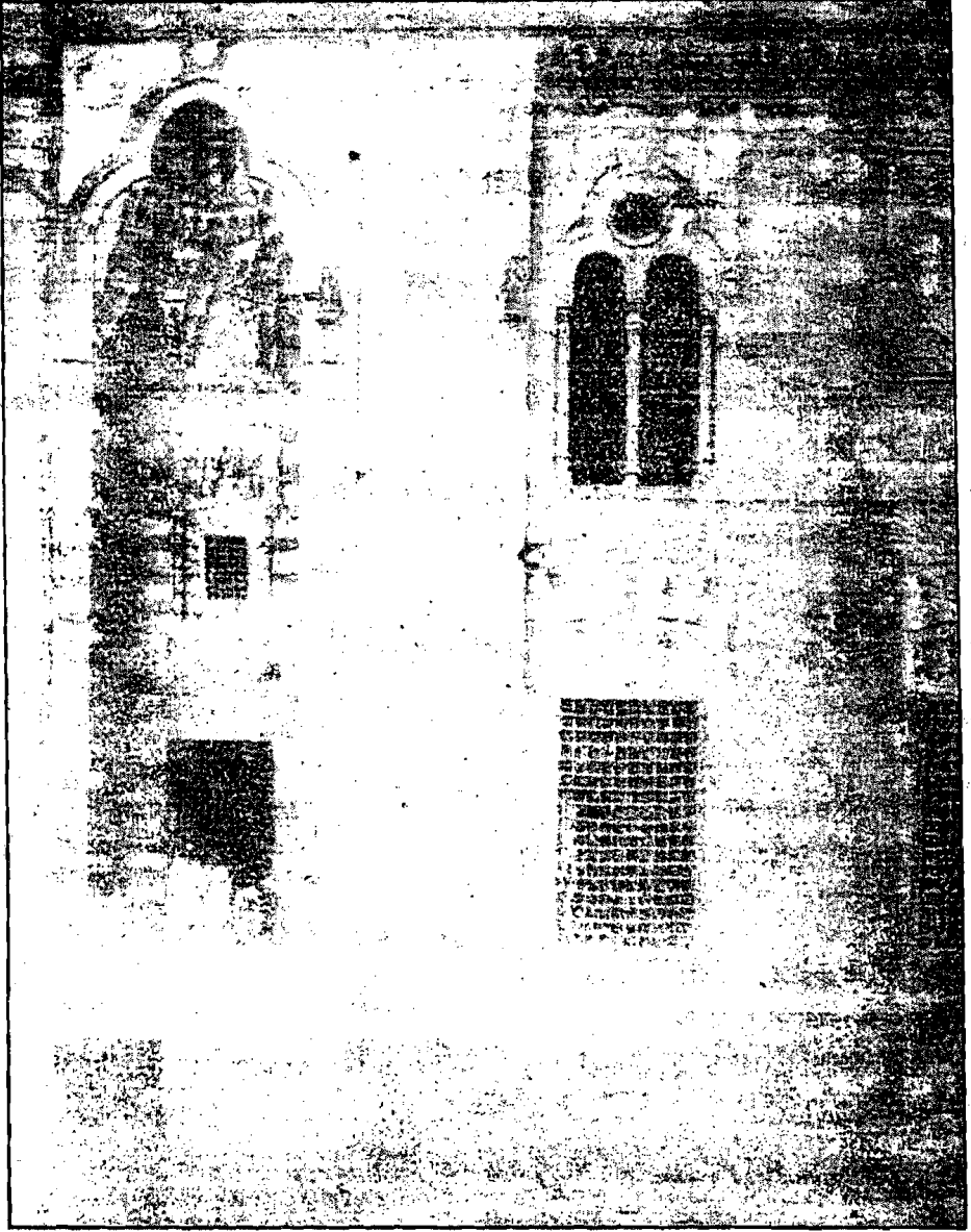
باب قبة الغورى فى شارع الغورية